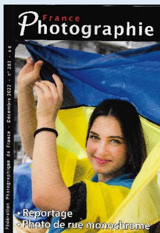
France "Photographie N° 283 de décembre 2022