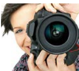
Photo-club de Roissy en Brie

Association culturelle et photographique du groupe Néopost 113, rue Jean-Marie Naudin, 92220 – Bagneux